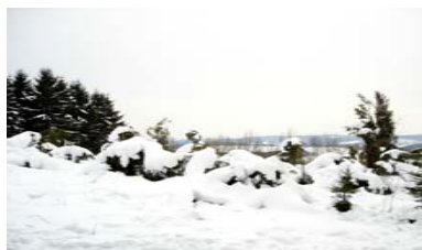
Winter auf der Silberkuhle

Schon der Name Silberkuhle deutet auf den Erzbergbau vergangener Zeiten hin. Wegen seiner reichen Bleierzlager mit einem sehr hohen Silbergehalt - z. T. über 500 g/t verhüttungsfähigen Erzes - spielte Eckenhagen schon im frühen Mittelalter eine bedeutende Rolle.