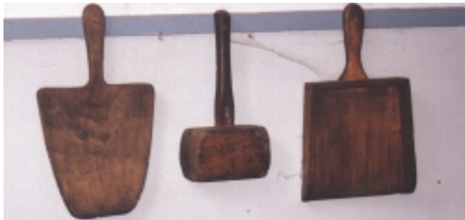
Die hölzernen Werkzeuge der Pulvermacher

Mit Pferdewagen ging es - von der Schmiede und Gastwirtschaft in Gogarten - auf oft eigenen Wegen und manchmal auch nachts unter Wahrung strikter Sicherheitsvorschriften auf die lange Tour. Ziele waren die deutschen Seehäfen, aber auch Ungarn, Ostpreußen und Straßburg. Das begehrte Rönsahler Pulver wurde über hundert Jahre als das wichtigste Pulver in Schweden, Norwegen und der Schweiz gehandelt. Auf den Fahrten war eine Fahne mit einem „P“ (für Pulver) als Gefahrenzeichen am Wagen angebracht. Nur ausgebildete Pferdefuhrleute konnten diese gefährliche Fracht führen. Der erfahrene Fuhrmann hatte Begleiter dabei, die den Gefahrentransport bei der Durchfahrt einer Ortschaft ankündigten. Dennoch gab es Unglücke und Spuren sind auch in Nähe der Pulverwege zu finden. Dennoch hielten die Pulverarbeiter der Firma die Treue. Über 300 Jahre lang entstand so im Tal der Wipper ein wahrer Schatz - der selbst Kaiser Wilhelm II einen Besuch dort wert war. Der Krieg aber und die Herstellung von Militärpulver in Rübeland/Harz - der Gegenwert waren wertlose Kriegsanleihen - brachte das rasche Ende der Schwarzpulverindustrie der Firma Cramer & Buchholz: der Reichtum verpuffte wie das Pulver.