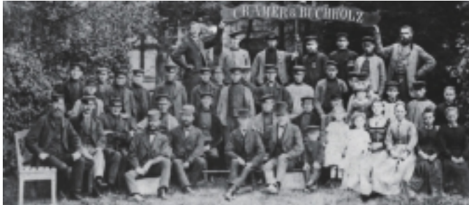
Die Belegschaft der Firma Cramer & Buchholz (1880)