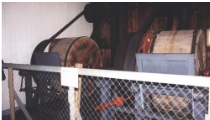
In Trommelanlagen wurde das Pulver zu Kügelchen geformt.

Die Vermischung der Zutaten des Pulvers, Salpeter, Schwefel und Kohle (aus dem Faulbaumholz geköhler) geschah in Poch- und Stampfwerken. Dabei schlugen Pochstempel, unten mit Blei beschuht, im freien Fall in den Pochtrog. Durch eine wassergetriebene Daumenwelle, eine Welle mit Hebearmen, wurden die Stempel wieder hochgebracht. Man stampfte 24 Stunden und setzte dem Material immer wieder Wasser zu, denn Pulverstaub war der gefährlichste Begleiter. Je größer die Verdichtung des Pulvers, um so gezielter ging die Verbrennung vor sich. Nach dem Stampfprozeß, es wurden zunächst nur zwei der drei Zutaten miteinander vermischt, hieß es dann, sehr vorsichtig zu sein. Alle Handwerkszeuge waren aus Holz oder Messing. Kein Funke durfte entstehen. Kein Eisen mit sich geführt werden. Durch Messingsiebe wurde die feuchte Pulvermasse gedrückt, um danach in Trommeln mit Grafit zu „Kugeln“ geformt zu werden. Diese Form trat der Entmischung während des Transportes entgegen. In Abfüllanlagen wurden dann die Pulvermassen in verschiedenen Körnungen versandfertig gemacht und zumeist in Fässer gefüllt.