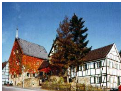
Museum für Bergbau, Handwerk und Gewerbe im historischen Türmchenhaus

Gerne stellen die am Fernwanderweg 30 liegenden SGV-Ortsvereine ihre Wanderprogramme zur Verfügung, oder wenden Sie sich bitte mit ihren speziellen an den SGV-Bezirk Bergisches Land e.V.