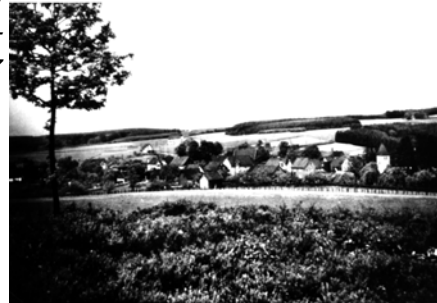
Müllenbach um 1925. Das Kirchdorf hatte damals 405 Einwohner

nachweisbare Siedlungsplatz der Gemeinde im Bereich der Müllenbacher Kirche gelegen hat.