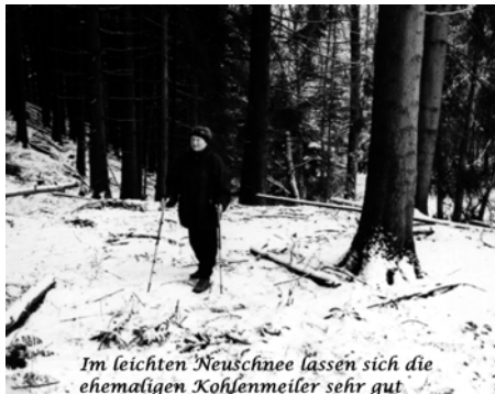
Im leichten Neuschnee lassen sich die ehemaligen Kohlenmeiler sehr gut im Unnenberger Gebiet erkennen.

Vor dem Wanderparkplatz biegen wir mit dem Zeichen A 3, V 6 halbrechts bergab. Der Weg wird nun wieder steiler. Wir überqueren 2 Wirtschaftswege, verfolgen weiter das Zeichen A 3 und erreichen nach etwa 1 200 m die Talsohle (290 m) und den Wanderparkplatz „Dahler Brücke“. Auf diesem steilen Abstieg, der einst Kirchweg der Unnenberger Dorfbewohner nach Müllenbach war und mit Pferdefuhrwerken rauf und runter befahren wurde, fallen uns weitere Zeichen auf: weiße Punkte. Wir befinden uns auf den „Kulturpfaden Marienheide“ nach der ersten Überquerung des ersten Wirtschaftsweges zeigen sie einen besonders gut erhaltenen Kohlen-