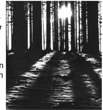
Stimmung im Gervershagener Forst

wirtschaftlich genutzt, danach begann im großen Stil die Aufforstung mit Fichten. Das Forsthaus sehen wir nicht.