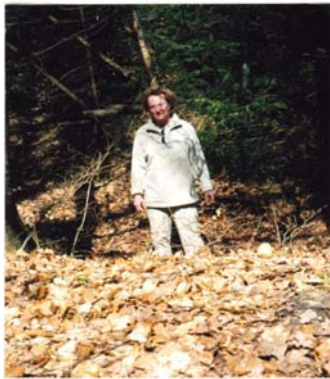
Einsturztrichter bei Börlinghausen

sehen wir einige „Pingen“, das sind Einsturztrichter der Förder- und Bewetterungsschächte, also Relikte, die von der einstigen Bergbauherrlichkeit noch geblieben sind. Der Wanderweg mit dem Zeichen N (Naturfreunde) biegt nach rechts. Wir folgen und sehen unter einem Hochsitz noch einmal besonders deutlich ausgeprägte Einsturztrichter. Es folgt die Überquerung der Eisenbahnschienen. Genau hier verlief bis 1946 die alte rheinisch-westfälische Provinzialgrenze, heute Kreisgrenze. Rechts und links sind sowohl Schlackenhalde sowie auch die Abzugsgräben der Eisensteinwä-sche zu erkennen.