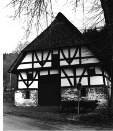
Haus Schenk in Dahl

Das alte Bauernhaus in Dahl wurde 1586 erbaut. Es ist ein Fachwerkhaus mit Bruchsteinsockel und strohgedecktem Krüppelwalmdach. Der Oberbergische Kreis hat das Haus 1963 gekauft und in seiner ursprünglichen Form wieder restaurieren lassen. 2002 bis 2003 musste eine gründliche Hausan-sanierung vorgenommen werden.